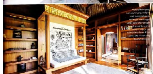
Ruang baca yang nyaman dengan koleksi buku-buku yang lengkap.