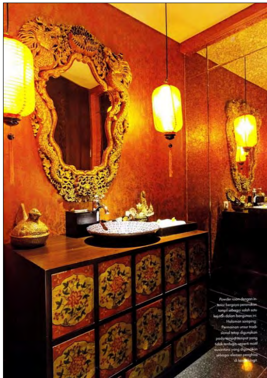
Asitektur room dengan interior bergaya peranakan, tempat sebagai salah satu keajaiban dalam bangunan ini. Halaman samping Perumahan umum ini adalah tempat digunakan pada home theater yang tidak kalah seperti resto restaurant yang di private house sebagai tempat di home theater .