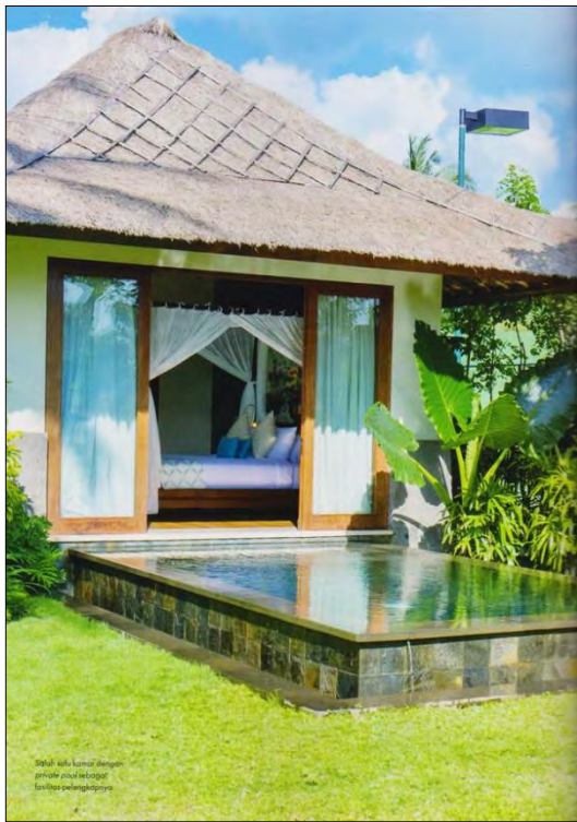
Bungalow Villa dengan private pool memiliki fasilitas yang lengkap.