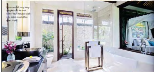
Ruang makan yang lengkap memiliki area duduk yang dapat mengakomodasi hingga 12 orang. Fasilitas ini ideal untuk acara-acara khusus.