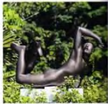
Sebuah karya patung ini menambah kesan art pada private villa ini.

ruangan dengan fasilitas lengkap, serta area spa yang terletak di keti dengan kolam renang utama untuk memanjakan diri. Bagian kedua akan dibangun rumah yang lebih playful yakni rumah kecil dan submersif. Bagian ini sengaja dibuat demikian agar mendapat suasana kontemporer, menginspirasi sang pemilik memuang sangat mewah dan menghibur karena seni kontemporer dari seluruh Asia. Di area ini terdapat ruang bermain, juga lapangan tenis, pada bagian belakang sehingga akan bisa aktif banyak dilakukan di sini. Pada bagian terakhir, HC 2 menggunakan suasana lokal yang terinspirasi dari rumah mewah keluarga Hoki Harkes. Di keti bagian tersebut ada beberapa tempat yang memiliki nilai lebih seperti master suite yang dibuat sangat cozy dengan fasilitas lengkap seperti walk in closet , room kerja , kamar mandi inflow dan outflow , hingga kolam renang khusus. Selain itu, ada area home theater yang dibuat HC 2 dengan gaya interior ala brother and Marlo . Keindahan setiap bangunan terinspirasi dengan suasana yang tidak banyak berkisar namun memancarkan banyak wahai keajaiban di dalamnya.