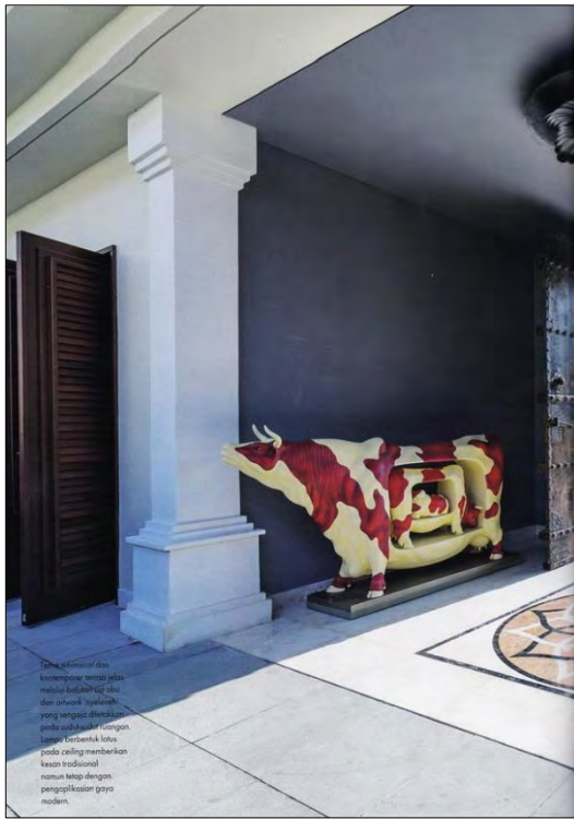
Desain interior dan kontemporer untuk villa ini adalah 'hybrid' yang menggabungkan pendekatan tradisional Bali pada ceiling memberikan kesan tradisional namun tetap dengan pengaplikasian gaya modern.