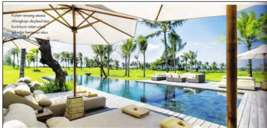
Kolam renang utama dilengkapi daybed dan kursi-kursi rotan untuk menikmati pemandangan.