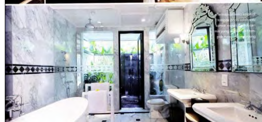
Ruang mandi yang luas dan modern dengan pemandangan langsung ke taman.