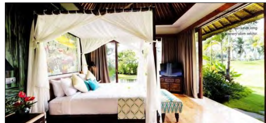
Ruang tidur yang luas dan nyaman dengan pemandangan langsung ke taman.