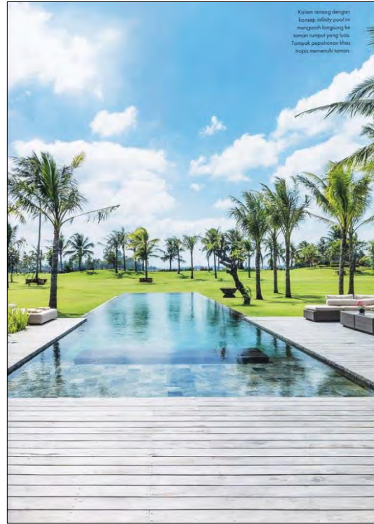
Kolam renang dengan konsep infinity pool ini manggah langsung ke taman hijau yang luas. Tampak pepohonan khas tropis memenuhi taman.