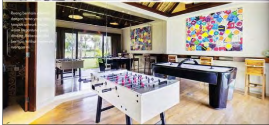
Ruang bermain dengan lengkap yang dapat mengakomodasi hingga 12 orang. Fasilitas ini ideal untuk acara-acara khusus.